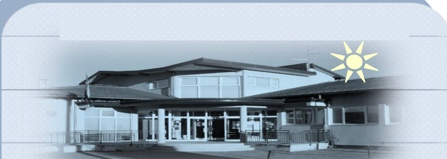
Osnovna škola „Ivan Goran Kovačić“ Lišane Ostrovičke