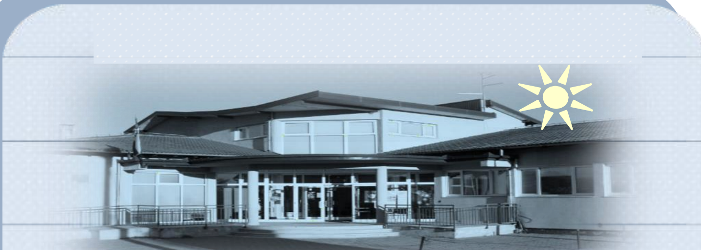
Osnovna škola „Ivan Goran Kovačić“ Lišane Ostrovičke