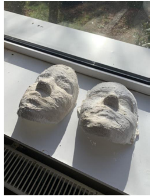
Tehnika izrade maske otiskivanjem lica sa gipsanim zavojem, veljača 2024