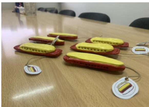
Izrada suvenira Cvitare , rujan-studenii 2023